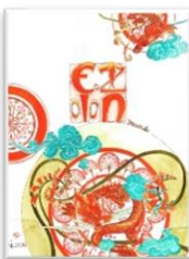
榮春先生 「イラスト 結 musubi」